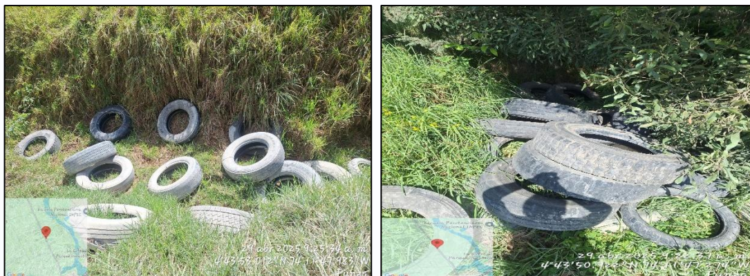
Ilustración 2. Evidencia Puntos Críticos

Durante la jornada, el personal de la Secretaría de Ambiente y Bienestar Animal Funza llevaron a cabo el levantamiento de las llantas que se encontraban en el vallado (ver ilustración 2)