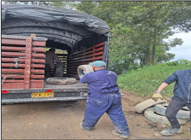
Ilustración 5. Recolección de residuos.