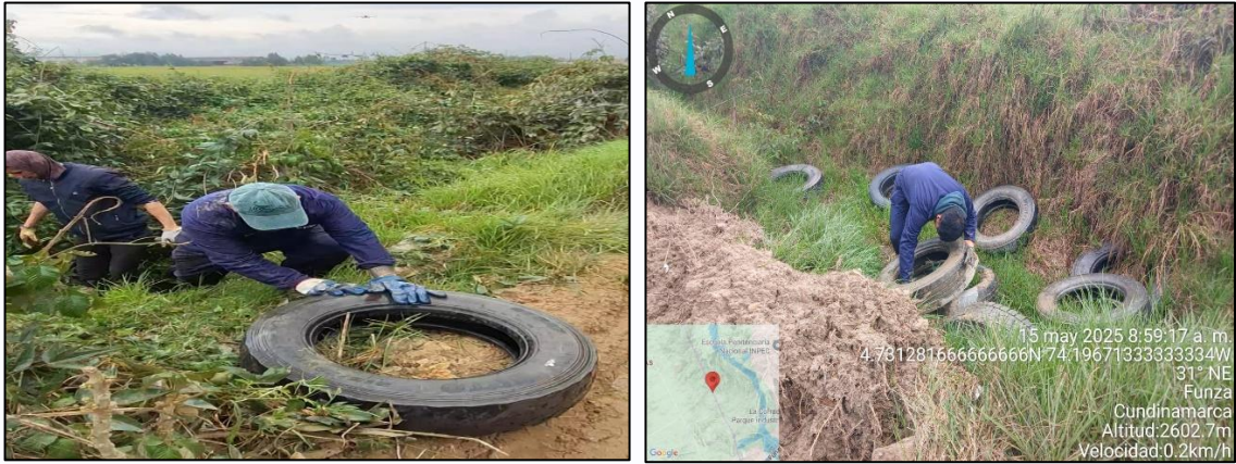
Ilustración 3. Levantamiento llantas.

Una vez recuperado el punto (ver ilustración 4), se realizó la respectiva recolección para su debido transporte a las instalaciones de la Secretaría de Ambiente y Bienestar Animal, ya que estas llantas serian utilizadas en la jornada de reciclaron (ver ilustración 5).