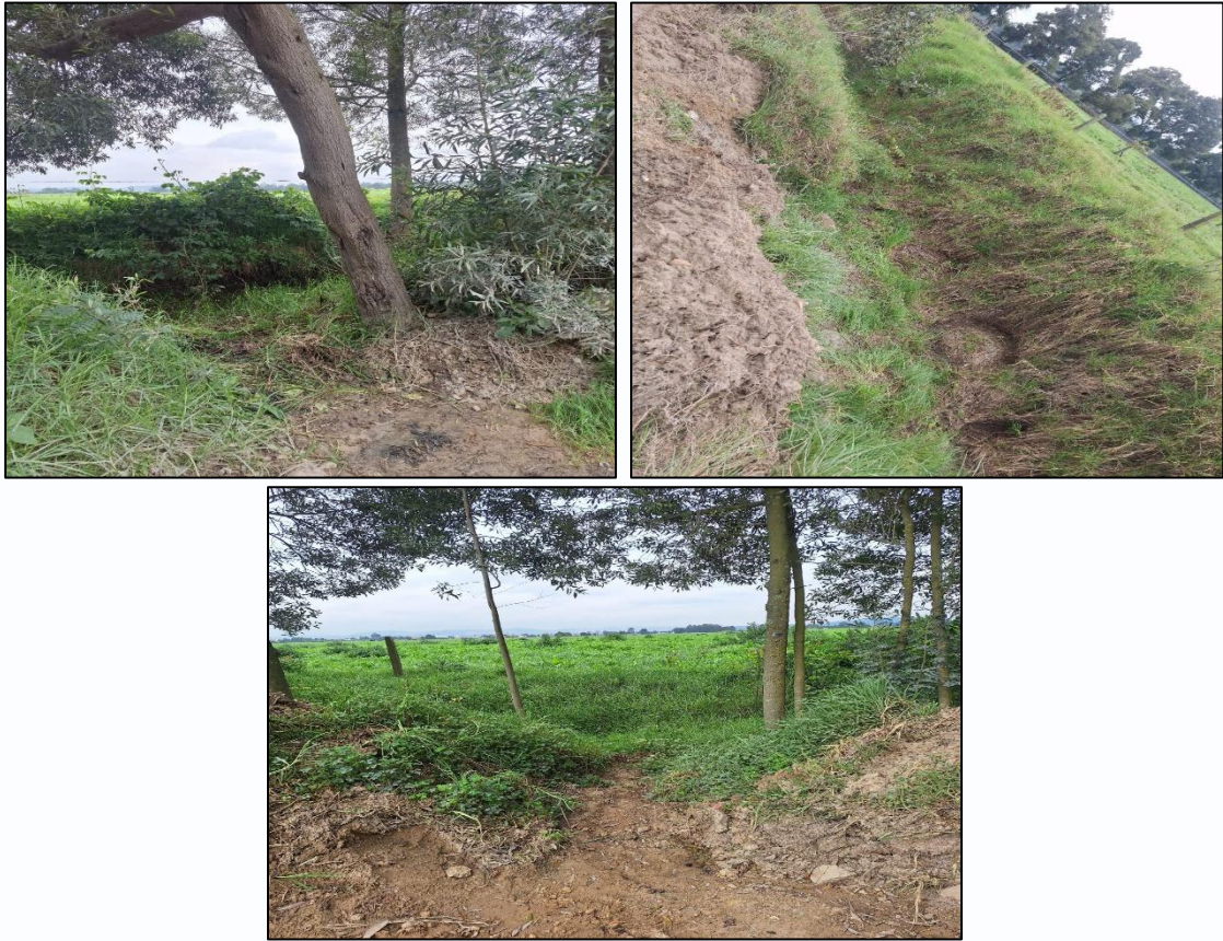
Ilustración 4. Punto recuperado

Una vez recuperado el punto (ver ilustración 4), se realizó la respectiva recolección para su debido transporte a las instalaciones de la Secretaría de Ambiente y Bienestar Animal, ya que estas llantas serian utilizadas en la jornada de reciclaron (ver ilustración 5).